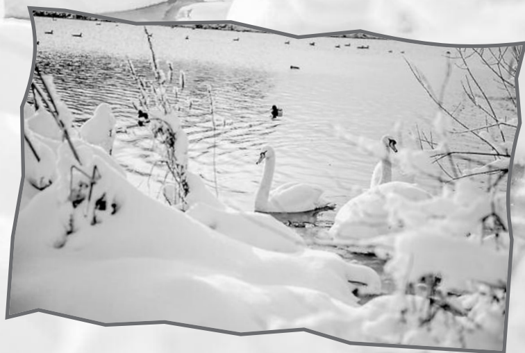
Christoph Konle Bürgermeister