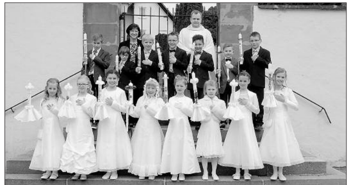
In diesem Jahr haben sich 15 Kinder aus unserer Pfarrgemeinde St. Martinus zum Fest der heiligen Erstkommunion, unter dem